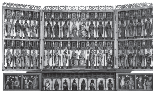
Niguliste kiriku pealtari retaabel täielikult avatuna

9. Mis aastatel valmis Niguliste kiriku pealtari retaabel, kui võtta aluseks ajalooürikud ja tehniliste uuringute tulemused?